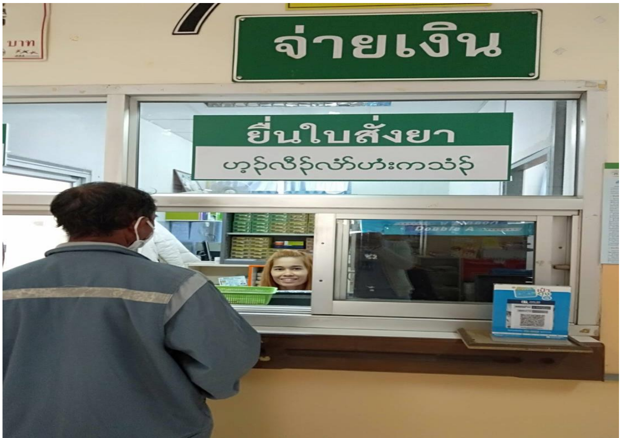
6. รับยาที่ห้องยา เบอร์ 6